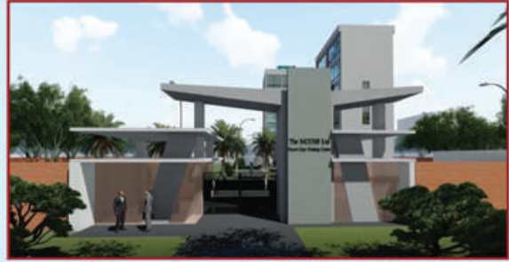
সোসাইটির আয়বর্ধকমূলক প্রকল্প 'রিসোর্ট কাম-ট্রেনিং সেন্টার'