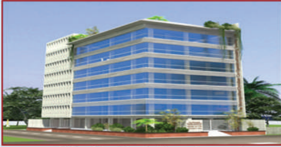
সোসাইটির স্থায়ী কার্যালয় 'আর্চবিশপ মাইকেল ভবন'